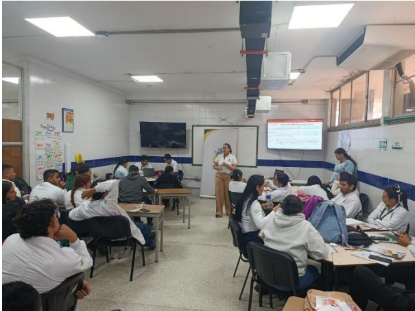
Socializacion Politica Publica de Mujer y Equidad de Genero